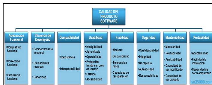
Figura 1. Modelo de calidad del producto de software.

Tomando como referente los anteriores resultados, podríamos conjuntar la norma internacional ISO/IEC 25010, con los aspectos mencionados por Pere Marquès Graells [12], solo que adecuándolo a las necesidades actuales e involucrando además aspectos técnicos que deben tomarse en cuenta de un software educativo, daría como resultado el Modelo de Aspectos Funcionales, Pedagógicos y Técnicos del Software Educativo (MASFUPEyTEC-SE).